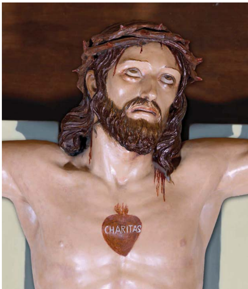
Crocifisso Amore Misericordioso

Cuore di Gesù e per la Sua dolorosa Passione mostraci la Tua misericordia, affinché per tutti i secoli possiamo esaltare l'onnipotenza della Tua misericordia. Amen.